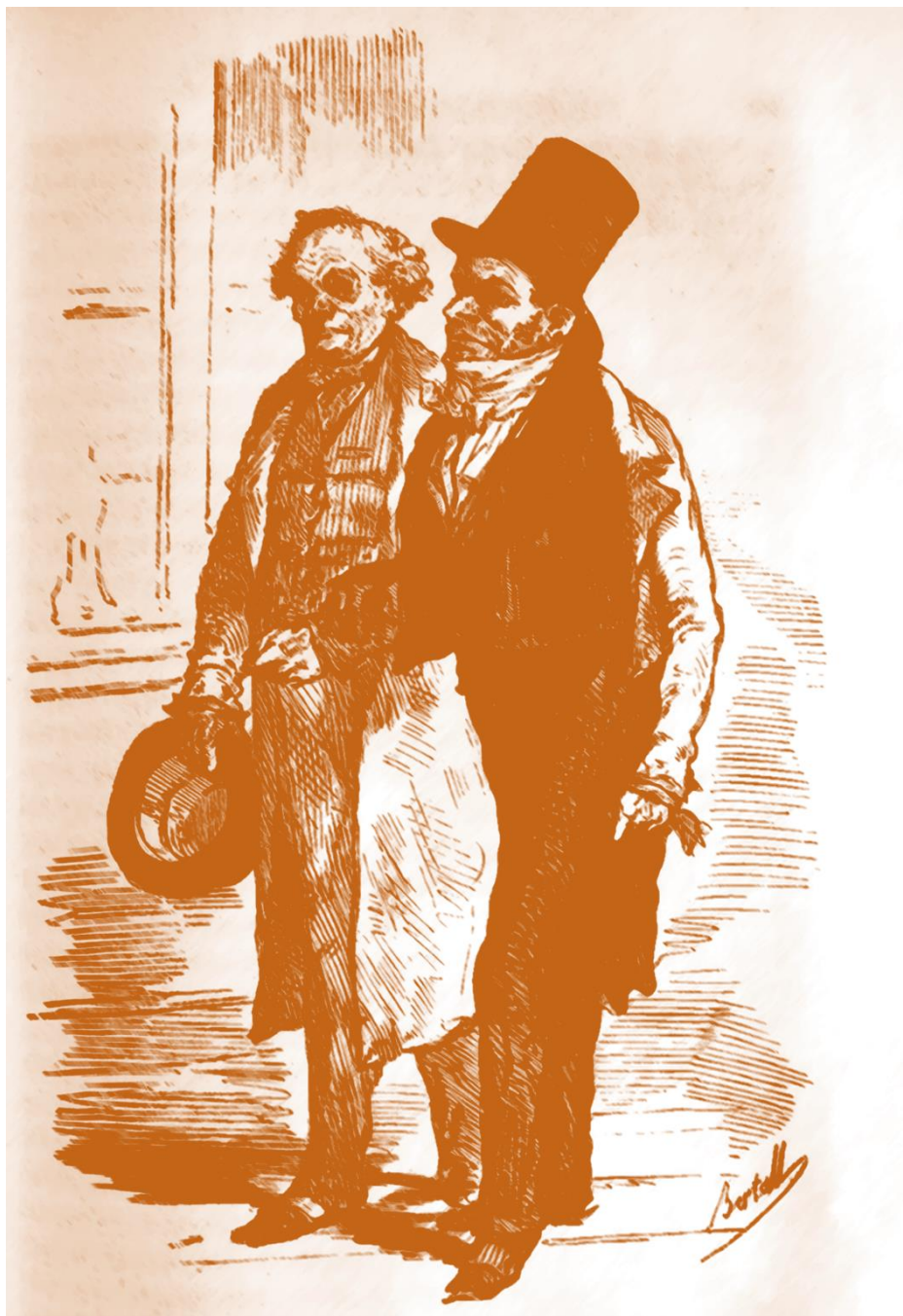
D'après Bertall, Les Deux Casse-noisettes , Paris, Furne, 1848

23-24 novembre 2018 École Normale Supérieure de la rue d'Ulm